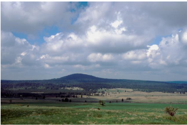
Pohled na Božídarské rašeliniště – v pozadí Špičák