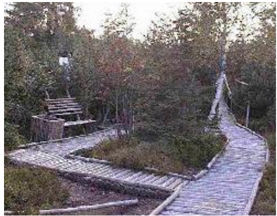
Stávající stezka – před opravou

Božídarské rašeliniště bylo vyhlášeno r. 1965 chráněným přírodním územím a v r. 1972 byla zřízena „Naučná stezka Božídarské rašeliniště“. Má rozlohu 929,57 ha, naučná okružní stezka má délku 3,2 km z níž část v délce 1,965 km vede nejcennější částí rašeliniště. Naučná stezka má celkem 12 zastávek s informačními tabulemi, upozorňujícími návštěvníky na cenné botanické, faunistické a historické prvky celého rašeliništního ekosystému. Stávající stezka sestává z povalového chodníku, různé šířky a charakteru, poškozeného hnilobou, zcela nespolehlivá a neschopná bezpečného provozu. Proto byly na místě vstupu umístěny tabulky se zákazem vstupu.