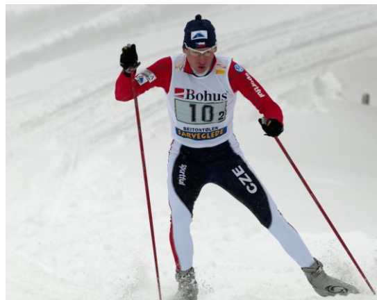
Lukáš Bauer – stříbrný olympionik, Vítěz Světového poháru

Partnerem přeshraničního projektu je sportovní oddíl Kurort Oberwiesenthal.