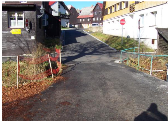
Mostek na větvi T

Kvalitní komunikace, dostatek parkovacích míst – to vše vytváří předpoklady pro další rozvoj turistického ruchu. Je to nezbytný, ale současně drahý krok, neboť to představuje rekonstrukci místních komunikací v celé tlušťce, včetně případných přeložek inženýrských sítí, vytvoření parkovacích míst a současně řešit je třeba řešit odvodnění komunikací.